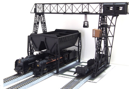
組立例 車両、線路並びに一部土台板は撮影用。 キットには含まず。写真は試作品です。