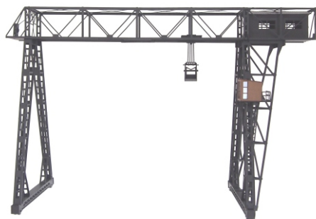
品番2038ガントリークレーン (ショート)