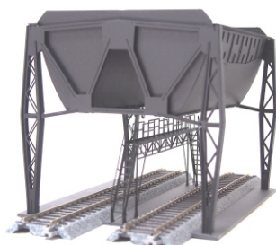
品番2037複線式給炭槽

2037・2038共通商品特徴 16番向けのペーパーキットです。 品番2005はスパン25m級、こちらは20M級です。給炭槽とガントリーが単品販売です。 また部品点数を半分以下にすることで価格と組立難易度を下げています。 給炭槽の土台板とガントリーの車輪がアクリル部品ですが専用接着剤は不要です。 木工ボンドで組立できますが、瞬間接着剤やゴム系接着剤があると便利です。